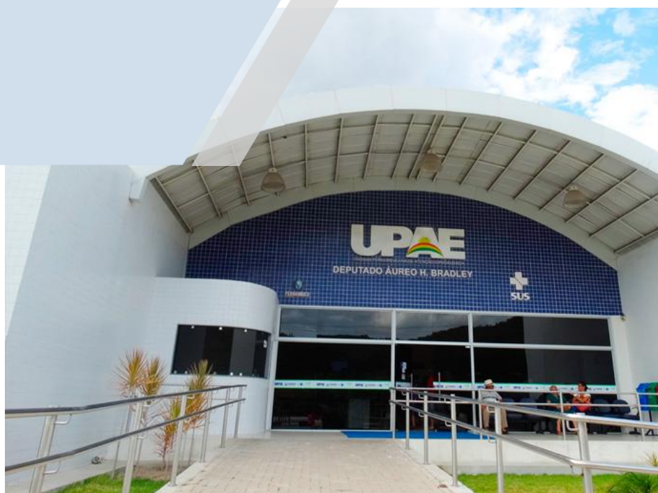
UPAE Arcoverde Unidade Pernambucana de Atenção Especializada