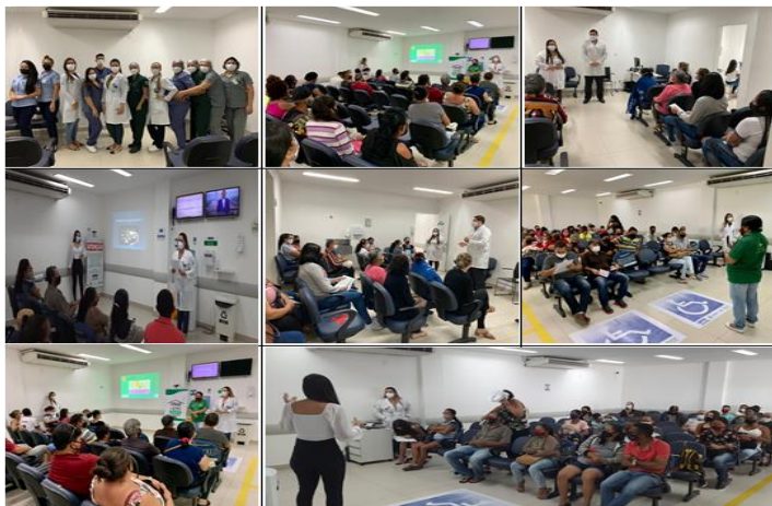
Figura 06 - Eventos Maio 2022