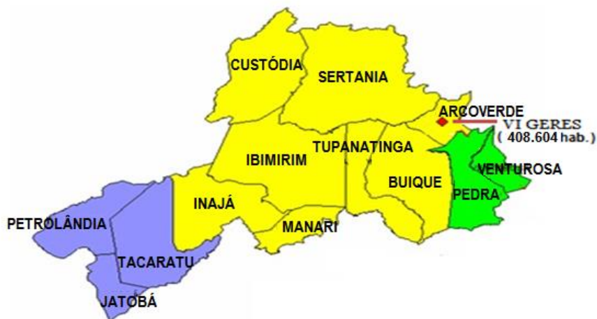
Figura 01 – Mapa dos municípios atendidos pela UPAE de Arcoverde.