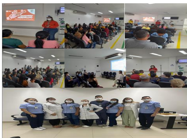
Figura 13 - Eventos Dezembro 2022