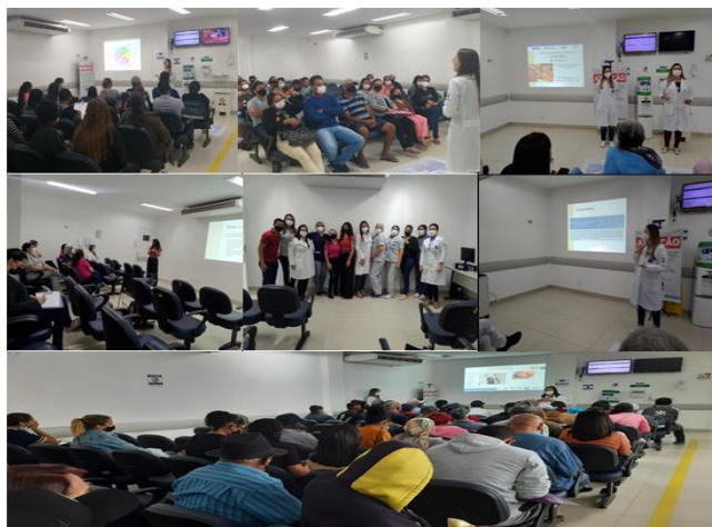
Figura 9 - Eventos Agosto 2022