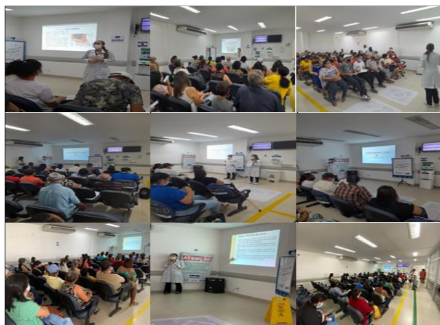
Figura 12 - Eventos Novembro 2022