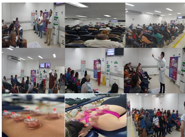
Figura 11 - Eventos Outubro 2022