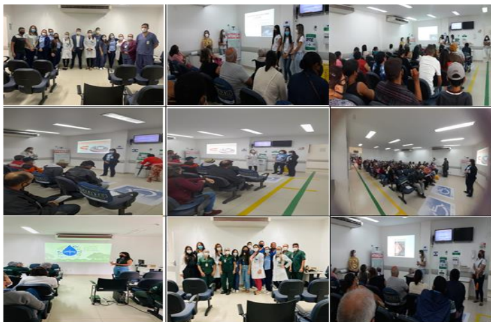
Figura 07 - Eventos Junho 2022