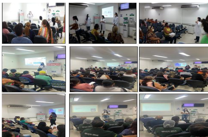
Figura 04 - Eventos Março 2022