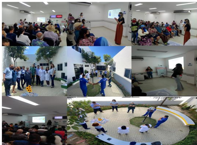
Figura 10 - Eventos Setembro 2022