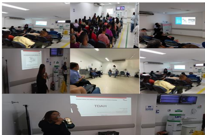
Figura 8 - Eventos Julho 2022