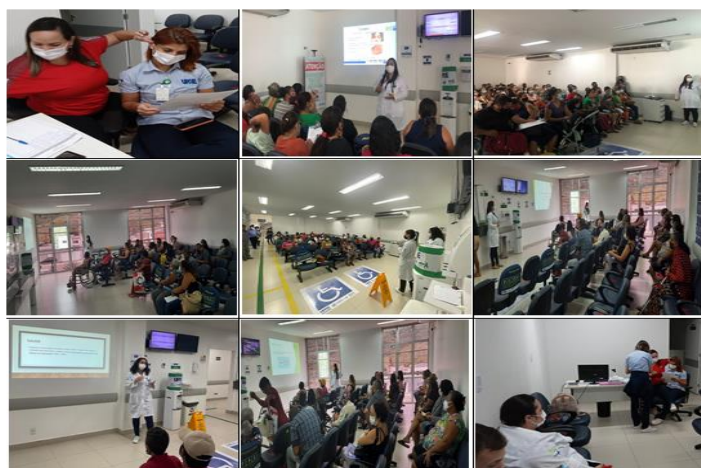
Figura 05 - Eventos Abril 2022